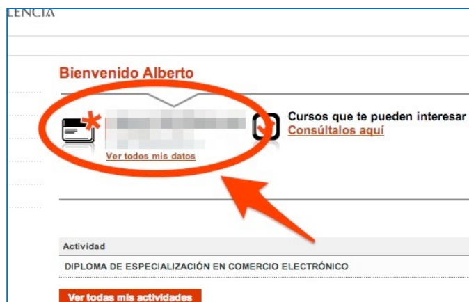
Acceso a datos personales