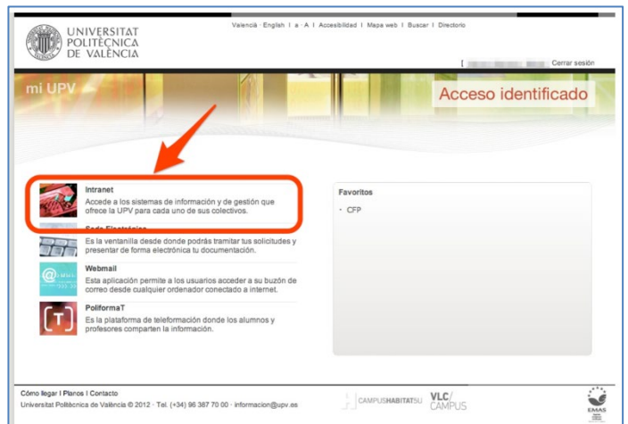
Acceso a la Intranet de la UPV